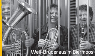
Well-Brüder aus'm Biermoos